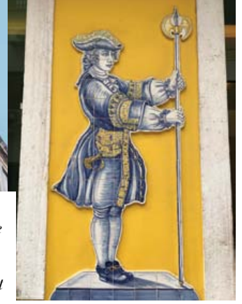
Porto'nun simgeleri, elde çizilmiş ve boyanmış porselen sanat eserleri