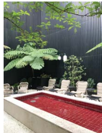
Hotel Valverde'nin Karayip stili bahçesi ve havuzu