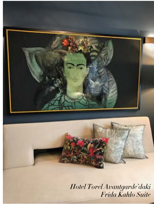
Hotel Torel Avantgarde'daki Frida Kahlo Suite