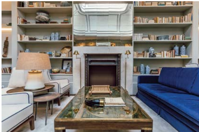
Torel 1884 Suites & Apartments lobisi