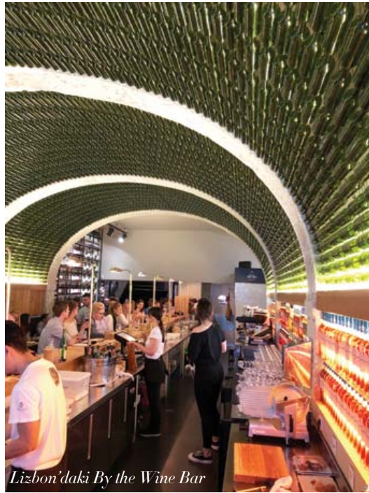
Lizbon'daki By the Wine Bar