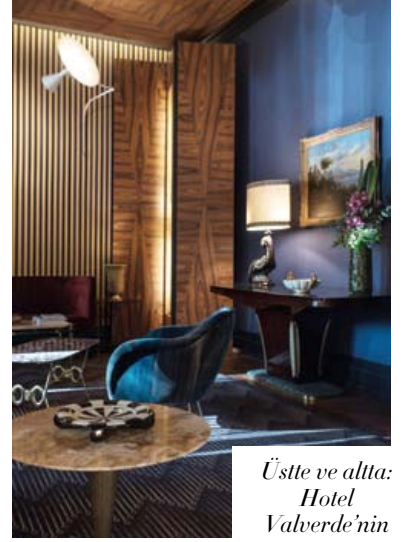
Üstte ve altta: Hotel Valverde'nin resepsiyonu ve odalarından biri